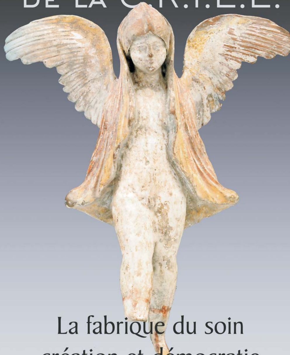
ART HELLENISTIQUE : EROS